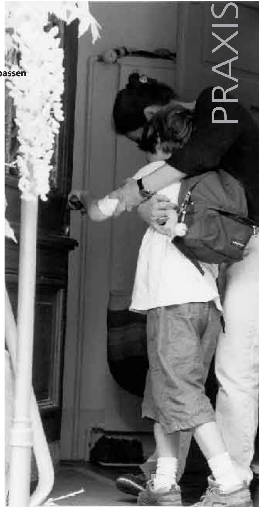
Besuche müssen so geregelt sein, dass die Kinder ohne extreme Belastung wieder in die Pflegefamilie – ihr Lebensumfeld – zurückkehren.